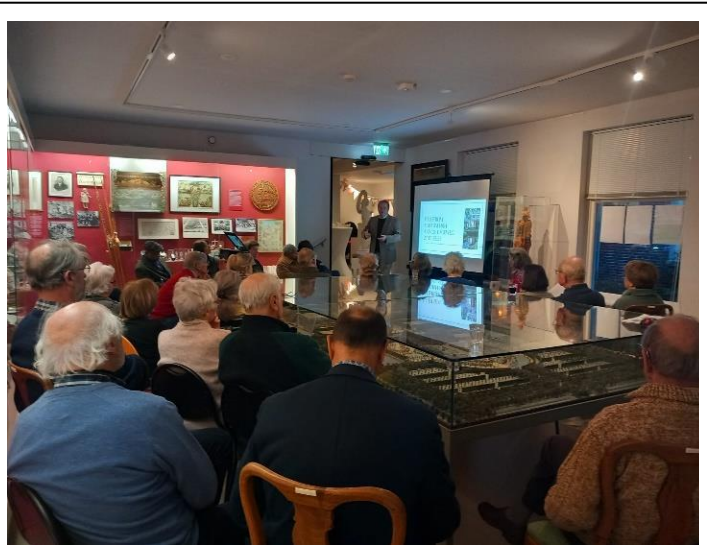
Viering 1 e HHH lustrum