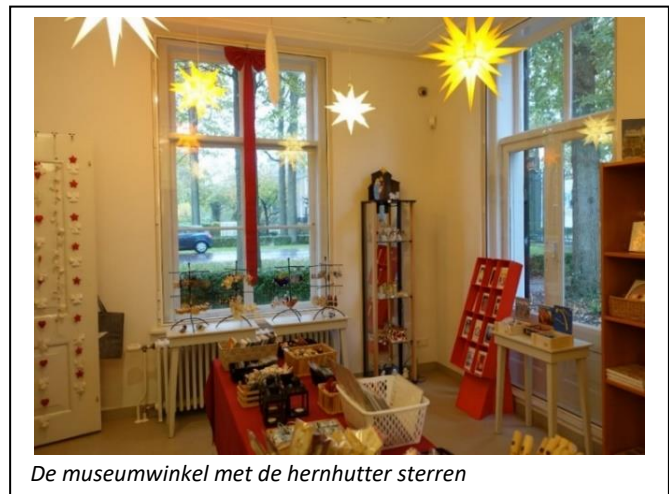
De museumwinkel met de hernhutter sterren