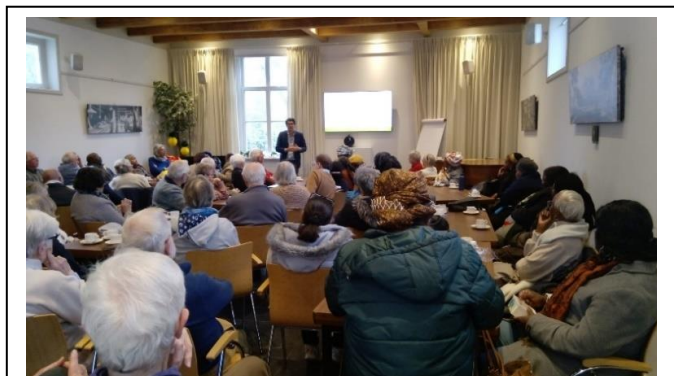
Lezing op 8 maart in het Koetshuys

De drie genoemde activiteiten hebben tezamen circa 115 belangstellenden getrokken.